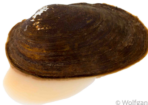
Bachmuschel ( Unio crassus )